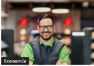
Noruega: Reducen jornada laboral y buscan acortarla aún más