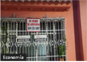
Ganancia ocasional en venta de inmuebles: exención y ahorro fiscal