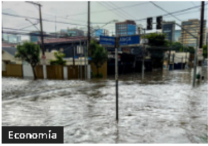
Fitch respalda acuerdo Gobierno-Banca, lanza alertas ejecución