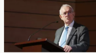
Exministro Ocampo advierte crisis fiscal para el próximo gobierno y critica impuesto al patrimonio a empresas