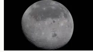
Artemis II cruza el lado oculto de la Luna y rompe récord de distancia: ya regresa a la Tierra