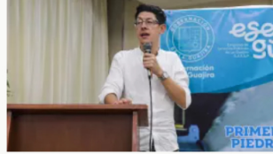
Ministro de Educación pide mesa técnica a Hacienda por impuesto al patrimonio a universidades privadas