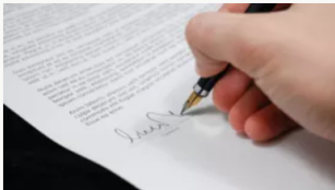
Lupa a cinco funcionarios de la Unidad de Víctimas por irregularidades en contratos de 2022