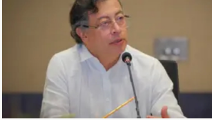
Petro acusa a la Fiscalía y al DNI de proteger a alias 'Papá Pitufo' y admite infiltración en su gobierno