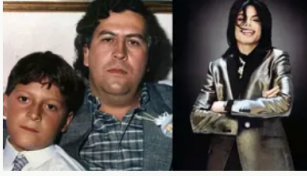
Hijo de Pablo Escobar revela que su padre planeaba secuestrar a Michael Jackson