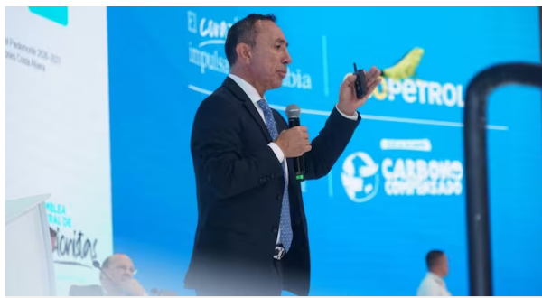
● Ecopetrol Ricardo Roa, presidente de Ecopetrol, durante la Asamblea de Accionistas.

Es decir, las vacaciones de Roa comienzan este martes 7 de abril y el 28 de mayo, cuando se acaba el periodo de vacaciones, comienza su licencia remunerada de 30 días, por lo que volverá al cargo el 28 de junio, cuando ya se conocerá el nombre del nuevo presidente de la República.