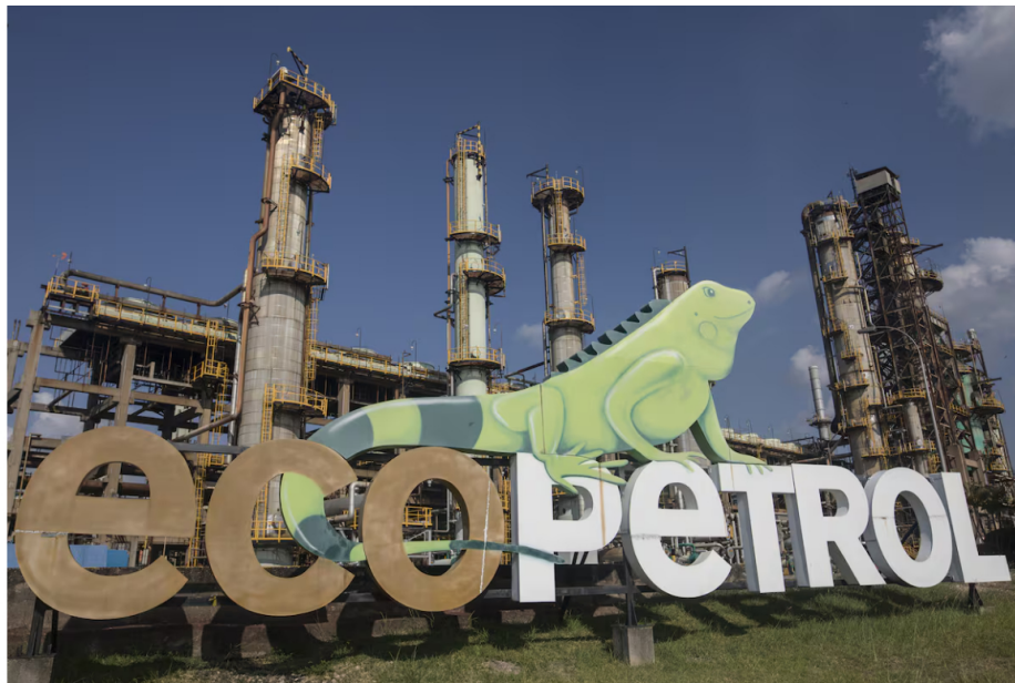
Complejo de Ecopetrol en Barrancabermeja, Colombia, en una imagen de archivo.