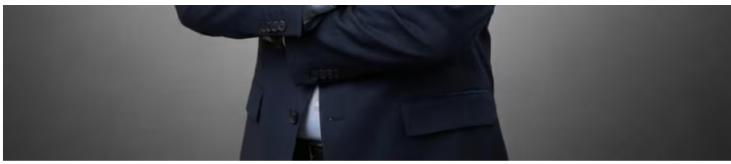
Juan Carlos Hurtado Parra, el presidente encargado de Ecopetrol.

El presidente encargado de Ecopetrol cuenta con 28 años de experiencia en el sector, que incluye una amplia trayectoria en Ecopetrol y el desempeño de posiciones ejecutivas en la Transportadora de Gas Internacional (TGI).