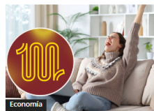
Lotería del Tolima: Resultados y Números Ganadores 6 Abr. 2026