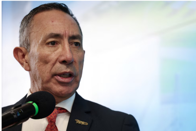
Ricardo Roa es presidente de Ecopetrol desde el 24 de abril de 2023. Reemplazó a Felipe Bayón en el cargo

La reunión que debía definir el futuro de Ricardo Roa, objeto de dos imputaciones penales, en la Presidencia de Ecopetrol se suspendió. El hecho dejó en el aire su permanencia al frente de la compañía. El aplazamiento agudizó la tensión institucional y elevó las preocupaciones dentro y fuera de la estatal, que está sujeta a rigurosos controles internacionales al cotizar en la Bolsa de Nueva York.