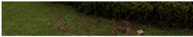
Ecopetrol es la empresa más rentable del Estado colombiano

La Casa de Nariño declaró de manera oficial que la supuesta reunión nunca figuró en la agenda presidencial ni del lunes ni del sábado previo. Sin embargo, medios como Caracol Radio reseñaron reuniones privadas entre Petro y algunos miembros de la Junta el sábado 4 de abril, lo que representa una obligación de reporte ante autoridades internacionales, ya que Ecopetrol transa en Wall Street.