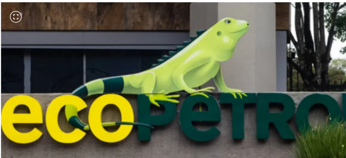
Ganancias de Ecopetrol podrían haber caído en segundo trimestre.

Una de las compañías se ubicó dentro de los primeros 10 puestos de este ranking internacional.