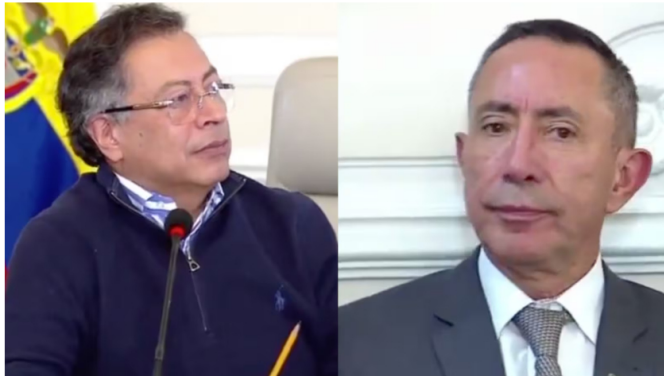
Gustavo Petro y Ricardo Roa.

El presidente criticó a su propia junta directiva tras aprobar la ausencia momentánea de Roa. Conozca las razones de esta drástica movida.