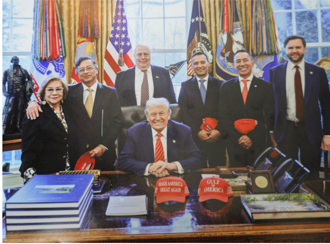
Fotografía en la reunión de febrero en la Casa Blanca con la delegación de Gustavo Petro.

"Nunca he oído una sola frase de alguien de E.E. U.U. hostil a Ecopetrol... Está Roa el presidente de Ecopetrol al que los miembros que delegué en la Junta directiva de Ecopetrol y que son mayoría, piensan sacar transitoriamente, les dije que se asustaron con las amenazas uribistas y de cambio radical de que los gringos buscan sacarlo", afirmó el mandatario, revelando las tensiones internas que precedieron la votación.