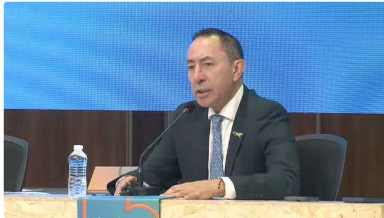
Ricardo Roa, en la asamblea ordinaria de Ecopetrol.

Era una de las alternativas que había para Ricardo Roa , presidente de Ecopetrol, ante la situación jurídica que enfrenta y que ha puesto a deliberar al equipo directivo durante varias jornadas.