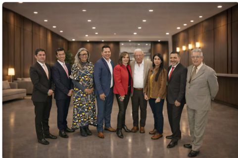
Junta de Ecopetrol 2026.

En otras palabras, Roa sale de Ecopetrol a partir de este martes 7 de abril y regresa después de las elecciones, inclusive, si hay segunda vuelta.