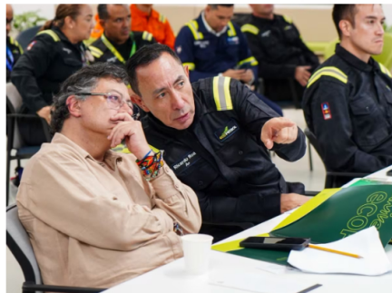
El jefe de Estado, Gustavo Petro, y el presidente de Ecopetrol, Ricardo Roa Barragán.

De hecho, en dos días, Roa Barragán afrontará su segunda imputación por parte de la Fiscalía. Esta vez, será señalado por la presunta violación de los toques de la campaña presidencial de 2022.