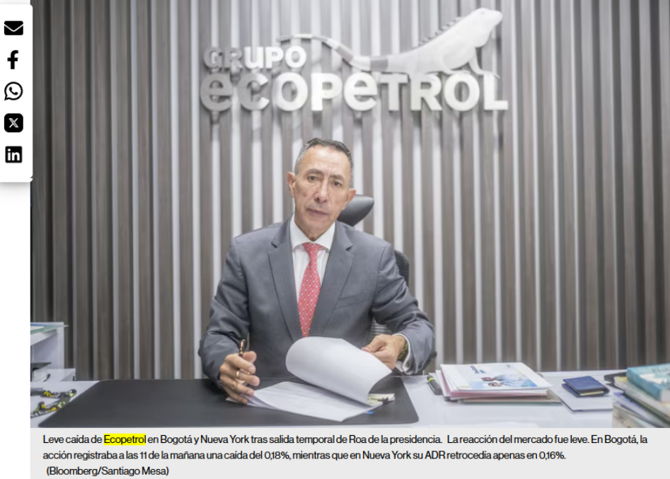
Leve caída de Ecopetrol en Bogotá y Nueva York tras salida temporal de Roa de la presidencia. La reacción del mercado fue leve. En Bogotá, la acción registraba a las 11 de la mañana una caída del 0,18%, mientras que en Nueva York su ADR retrocedía apenas en 0,16%.

En la noche del lunes se conoció que el CEO y exgerente de la campaña Petro Presidente tendrá una licencia no remunerada para enfrentar sus problemas judiciales.