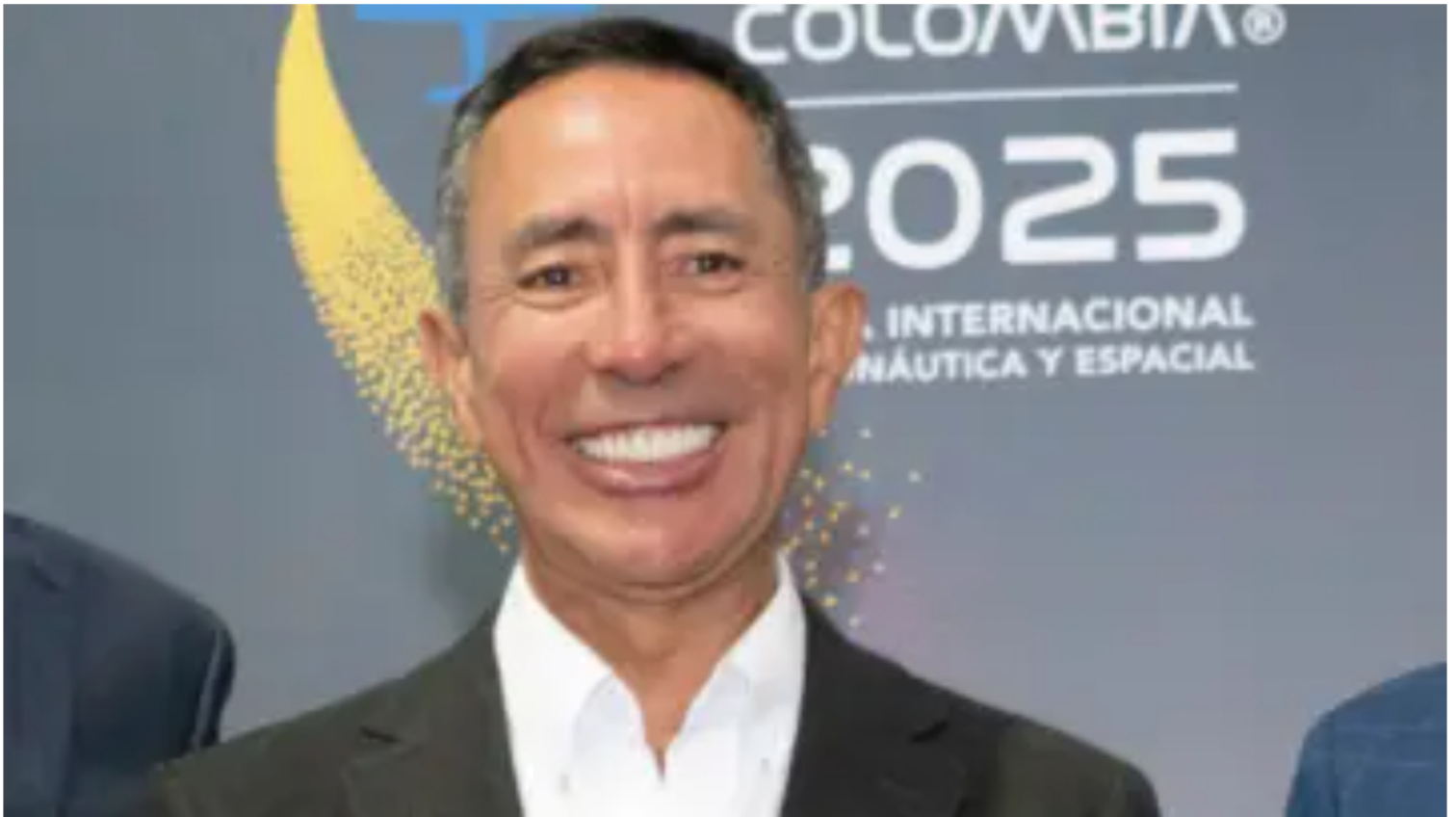
Ricardo Roa, presidente de Ecopetrol

“Lo que debe hacer un presidente de Ecopetrol es conducir la empresa, manejar su imagen a nivel nacional e internacional, sacar adelante los proyectos y preocuparse por recuperar las reservas de gas”, indicó.