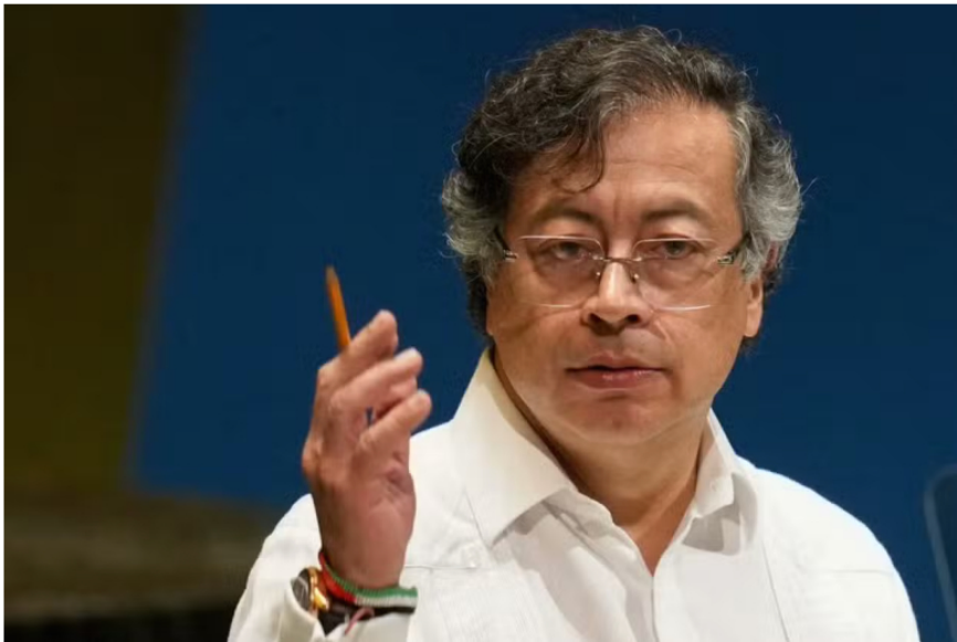
presidente de Colombia, Gustavo Petro