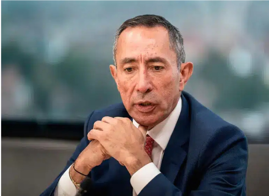
Imagen – Ricardo Roa, presidente de Ecopetrol

Mientras tanto, Ecopetrol atraviesa un momento complejo: sus ganancias cayeron un 40% en 2025 frente al año anterior, y las dudas sobre su rumbo siguen creciendo.