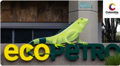
Actualidad · MAR 31 / 2026 Gustavo Petro plantea que Ecopetrol sea propiedad de sus trabajadores