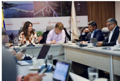
MinTransporte pide informe sobre posible reversión de Autopistas del Café