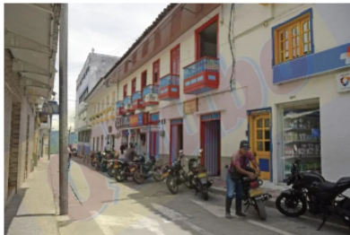
Accidente dejó a una joven en estado crítico