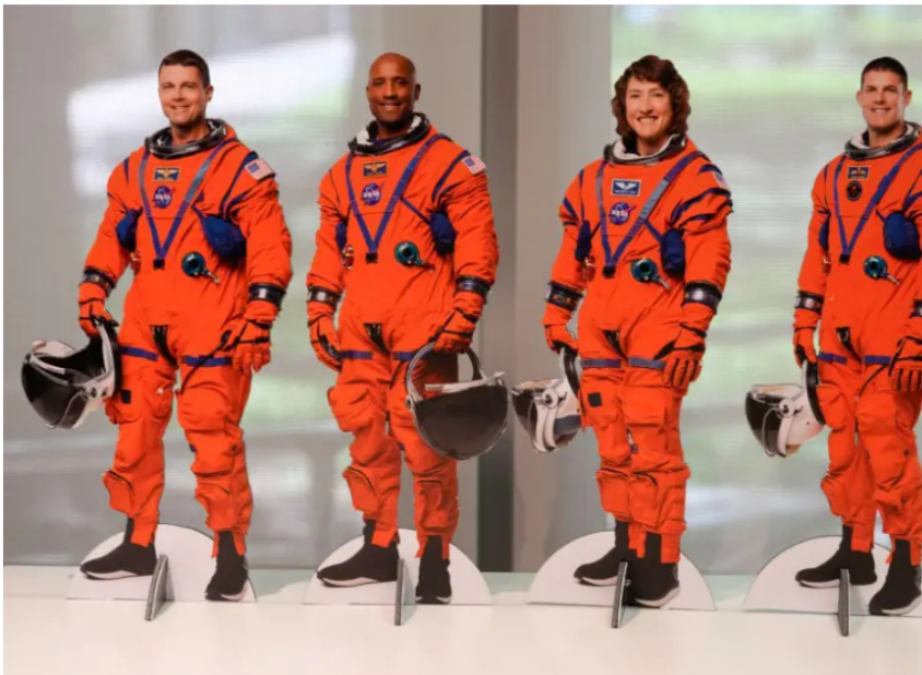
Artemis II está integrada por un equipo multidisciplinario de cuatro astronautas.