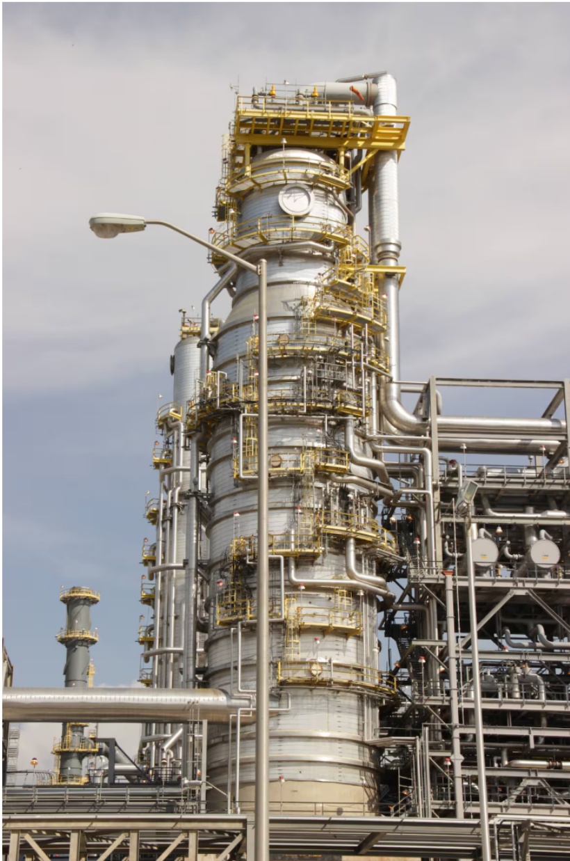
Refinería de Cartagena.