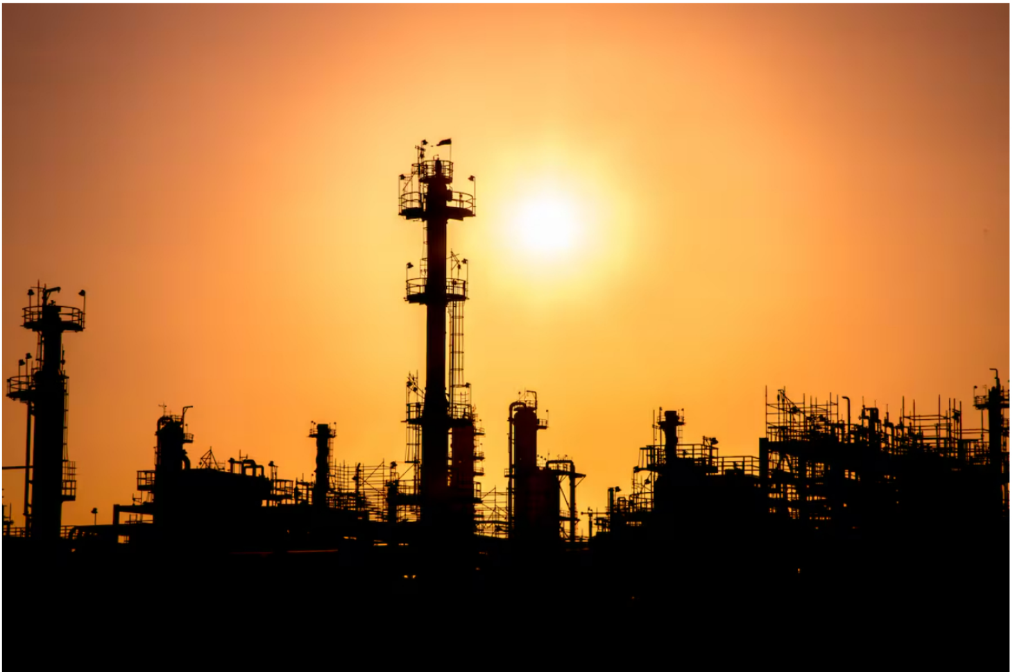
Refinería de Cartagena, en Mamonal. //Foto Archivo -El Universal

Siga las noticias de El Universal en Google Discover