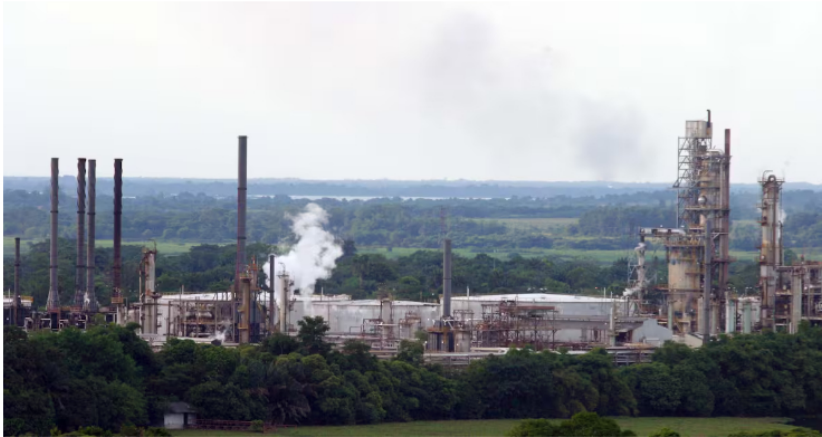
Refinería de Barrancabermeja (Santander).

Este desempeño fue posible gracias a la implementación del programa denominado “Refinación con un propósito”, que consisten entre otras, en el aprovechamiento al máximo de los activos de ambas refinерías de forma sinérgica, procurando obtener el mayor rendimiento de combustibles, petroquímicos y otros productos industriales de alto valor.