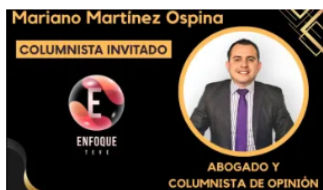
¿Cuál es la Junta Directiva ideal para Ecopetrol ?