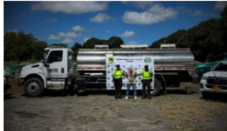
Sujeto fue capturado con 2.700 galones de hidrocarburos en Armero Guayabal