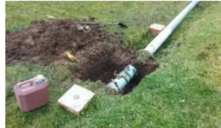
Ejército desmantela conexión ilegal de hidrocarburos