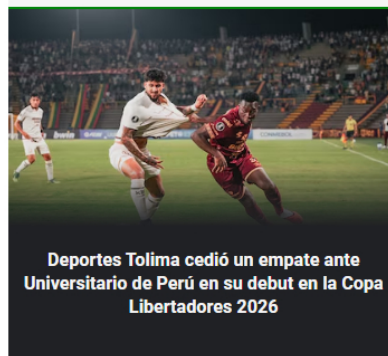
Deportes Tolima cedió un empate ante Universitario de Perú en su debut en la Copa Libertadores 2026

Los mejores memes que dejó el debut de Millonarios en la Copa Sudamericana con derrota 2-0 ante O'Higgins