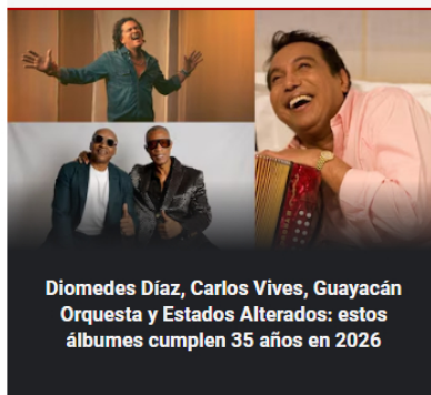
Diomedes Díaz, Carlos Vives, Guayacán Orquesta y Estados Alterados: estos álbumes cumplen 35 años en 2026

Hijo de Felipe Peláez se robó todas las miradas en las redes sociales del artista: "Tu clon"