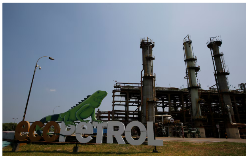
Ecopetrol es la empresa más rentable del Estado colombiano

La salida temporal de Ricardo Roa de la presidencia de Ecopetrol generó un impacto inmediato en la mayor petrolera de Colombia y en el comportamiento de la jornada bursátil del martes 7 de abril. La Junta Directiva autorizó una licencia no remunerada de 30 días para el funcionario, luego reconocer sus vacaciones programadas.