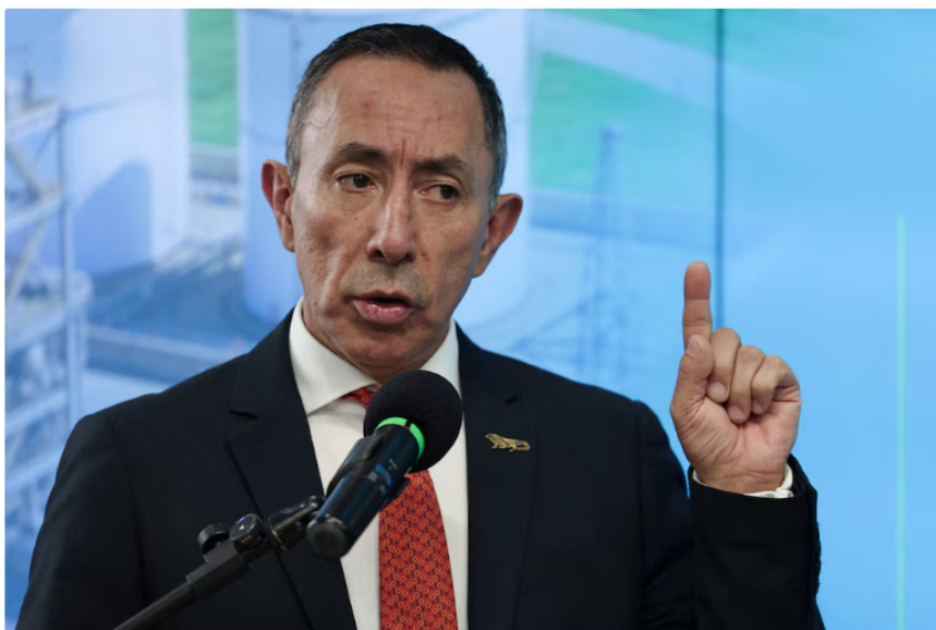
Ricardo Roa está en la Presidencia de Ecopetrol desde abril de 2023

A las 11:00 a. m., las acciones caían un 0,18% en Bogotá, lo que situaba el precio en $2.695. En Wall Street, el ADR (recibo de depósito americano en español) de Ecopetrol se cotizaba en USD14,64 ($53.847), con una baja del 0,16%.