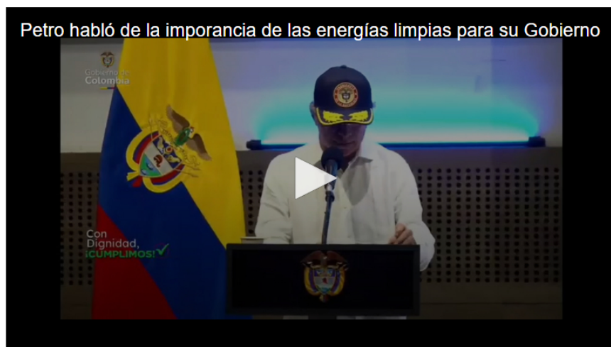
La transición hacia energías renovables busca proteger la salud y la vida de los colombianos, de acuerdo con Petro

El presidente Gustavo Petro se refirió el martes 7 de abril a la salida temporal de Ricardo Roa de la presidencia de Ecopetrol, tras un anuncio de la junta directiva que dejó al líder en licencia no remunerada tras sus vacaciones hasta después de las elecciones presidenciales, debido a conflictos judiciales pendientes.