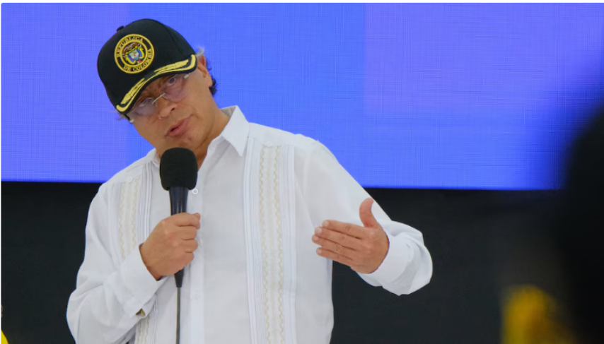
Gustavo Petro señaló que Colombia debe pasar de un modelo basado en extracción a uno enfocado en producción y conocimiento

El mandatario agregó que la extracción intensiva agota los recursos y que, a diferencia de la producción, esta última puede ser infinita mediante el aumento de productividad y conocimiento en la sociedad.