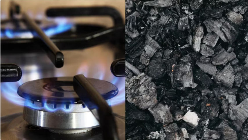
“Los hidrocarburos matan a la humanidad”, afirmó el presidente al hablar sobre energía limpia

“Los hidrocarburos, cuando terminan en la atmósfera a través de procesos productivos, matan a la humanidad y extinguen la vida. Esa es la conclusión de la ciencia”, señaló.