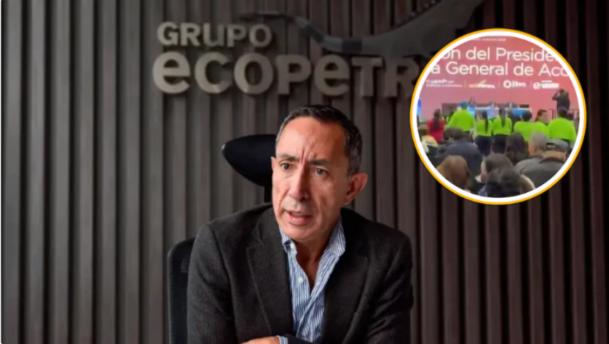
Accionistas minoritarios han expresado su rechazo a la permanencia de Ricardo Roa como presidente de Ecopetrol durante la sesión en Corferias

La decisión trascendió tras la imputación formal a Roa, de 63 años, por presunto tráfico de influencias, anunciada por la Fiscalía el 11 de marzo de 2026, y a solo un día de la citación legal por violaciones a los topes de financiación electoral, prevista para el miércoles 8 de abril, señaló el medio citado.