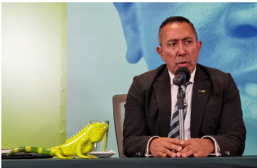
Revelan los detalles de la tensa reunión de la junta directiva de Ecopetrol en la que se determinó la salida de Ricardo Roa de la compañía estatal

A pesar de que la mayoría de los miembros de la junta directiva de Ecopetrol fueron designados por el gobierno de Gustavo Petro, la dirección de la petrolera estatal colombiana acordó el lunes 6 de abril de 2026 la salida de Ricardo Roa, presidente de la petrolera, mediante un mecanismo diplomático: combinación de vacaciones y licencia no remunerada.