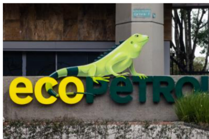
Ecopetrol encontró en Citgo su principal cliente en los Estados Unidos

Por sexto año consecutivo y gracias a las sanciones que el gobierno de los Estados Unidos le impuso a Petróleos de Venezuela (PDVSA), Colombia se anota que la empresa de refinación Citgo figure como el principal receptor del crudo de ese país. La Agencia de Información de Energía de los Estados Unidos (EIA) reportó las cifras certificadas de comercio petrolero del año 2025 cuando se registró que 24% de los envíos de petróleo y derivados colombianos a la nación estadounidense fueron justamente órdenes de Citgo. En promedio, durante el año pasado Ecopetrol envió 54.400 barriles diarios a Citgo, volumen que indica un incremento de 49% con respecto a lo que se despachó en 2024, pero está por debajo del pico alcanzado en 2022 cuando los suministros estuvieron por el orden de 66.400 barriles. La data de la EIA da cuenta que durante el primer trimestre del año pasado las transacciones entre Ecopetrol y Citgo reportaron un volumen