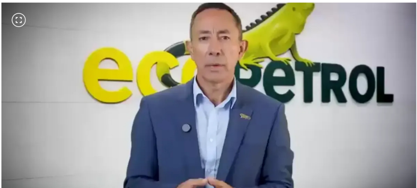
Ricardo Roa, presidente de Ecopetrol e investigado por la Fiscalía

Analistas y Gobierno fijan posiciones sobre los efectos de la licencia de Roa en medio de la atención del mercado.