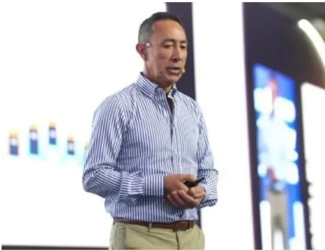
Ricardo Roa, presidente de Ecopetrol .

Por otro lado, el jefe de cartera también se refirió a la estructura de gobierno corporativo de la compañía . "Existe una maraña normativa alrededor de las responsabilidades en juntas directivas de empresas como Ecopetrol que asusta y confunde" , afirmó.