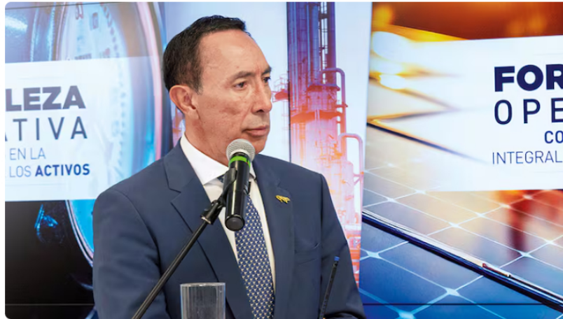
Ricardo Roa Presidente de Ecopetrol

Ricardo Roa tiene una cita con la justicia, incumplió dos encuentros con la Fiscalía: la imputación de cargos y una diligencia de interrogatorio que él mismo solicitó a través de su defensa.