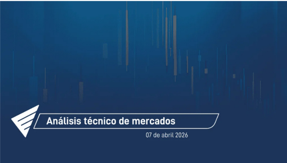
Acciones de Celsia y Ecopetrol lideran nuevas subidas en bolsa colombiana