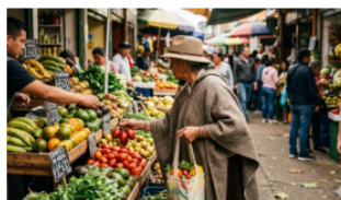
Cuatro factores que explicaron el