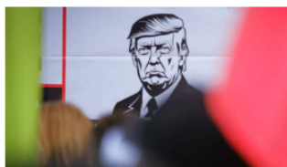
Premercado | Trump advierte