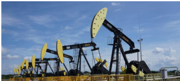
Los empresarios agremiados en la Andi proponen reactivar la asignación de nuevas áreas para exploración y conocimiento geológico del país.

“Las compañías de mayoría pública, que son mixtas, lo que trabajan todos los días y durante años es ganar esa percepción de que el manejo de la compañía no va a cambiar cuando llegue un Presidente que tiene una idea diferente”, señaló el analista.