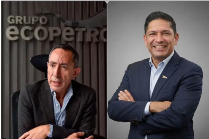
El directivo asume el mando mientras el titular atiende procesos legales. La transición busca dar estabilidad operativa y confianza a los mercados.

Siga las noticias de Vanguardia en Google Discover