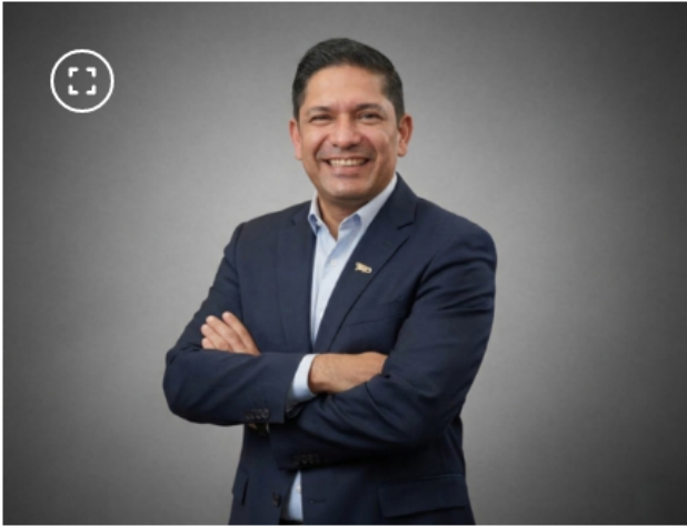
Juan Carlos Hurtado, presidente (e) de Ecopetrol .