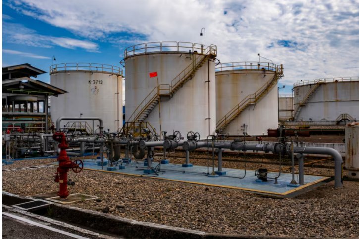
El petróleo eclipsa el ruido político en Ecopetrol, pero la calma podría ser temporal. A pesar de esos factores, el desempeño bursátil ha mostrado resiliencia, en un entorno donde el precio del crudo y los eventos geopolíticos han sido determinantes para sostener la valorización del activo.

El desempeño reciente refleja el peso del contexto geopolítico y los precios internacionales, pero el verdadero reto para la compañía llegará cuando los factores externos cedan y vuelvan a dominar las decisiones locales.