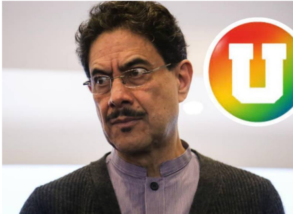
El Partido de la U retira su apoyo a Iván Cepeda para las elecciones presidenciales del 31 de mayo de 2026.

Los integrantes de esta bancada tomaron la decisión luego de una reunión en la que analizaron algunos aspectos relacionados con el panorama político del país.