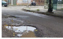
Denuncian deterioro vial en Las Granjas de Barrancabermeja