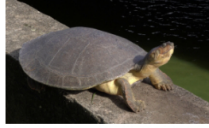
Arenal promueve cuidado de la fauna silvestre