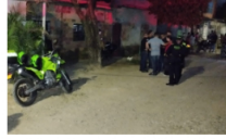
Ofrecen recompensa por crimen de menor en Barrancabermeja