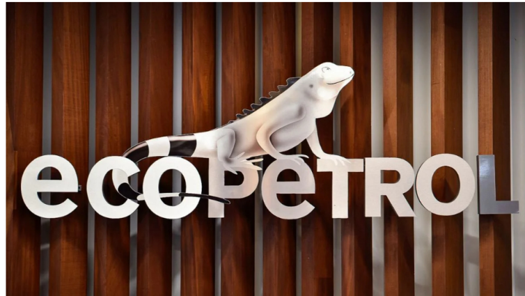
Empresa Colombiana de Petróleos (Ecopetrol).

La acción de Ecopetrol vive días de alta volatilidad en la Bolsa de Valores de Colombia , marcada por factores internacionales y decisiones internas de la compañía.