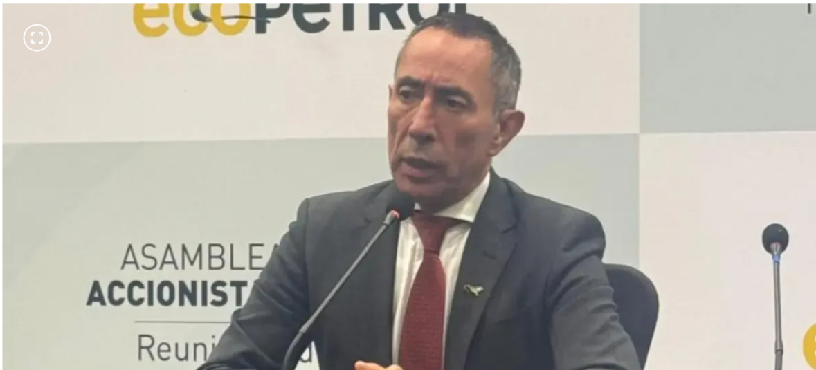
Ricardo Roa, presidente de Ecopetrol

El proceso está relacionado con su rol como gerente de la campaña presidencial de Gustavo Petro en 2022.