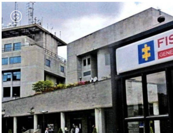
Fiscalia General de la Nación.

'Blu Radio' indicó que esta diligencia es clave dentro del proceso, ya que en ella la Fiscalía busca comunicar formalmente los cargos relacionados con la presunta violación de topes electorales durante la campaña de 2022.