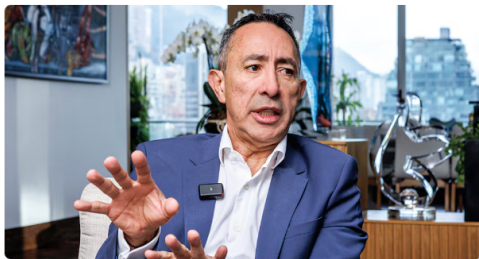
La Fiscalía citó por segunda vez al alto funcionario.

Los investigadores del caso concluyeron que el reporte entregado por el partido político no solo fue desordenado, sino que se manipularon algunos elementos, facturas y detalles para acercarse al monto establecido por la ley; sin embargo, se dejaron facturas por fuera que, al ser identificadas por la Fiscalía, elevaron automáticamente lo que se permite en estos procesos electorales.