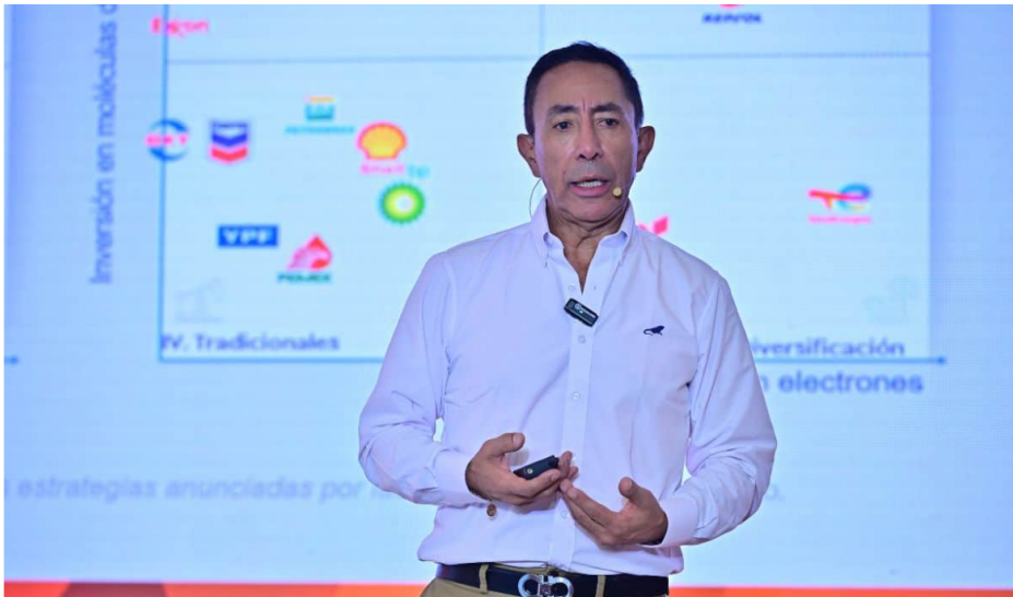
Ricardo Roa, presidente de Ecopetrol.

Mencionó que no se han presentado resultados tangibles y concretos que determinen la culpabilidad de Roa. Sin embargo, afirmó que la presión mediática y política ha sido alta y que, al estar conformado el Directorio por académicos y consultores, esa presión cayó sobre hombros que no están acostumbrados a gestionar una crisis de este tipo. Incluso señaló que él no habría tomado la decisión que finalmente adoptó el organismo.