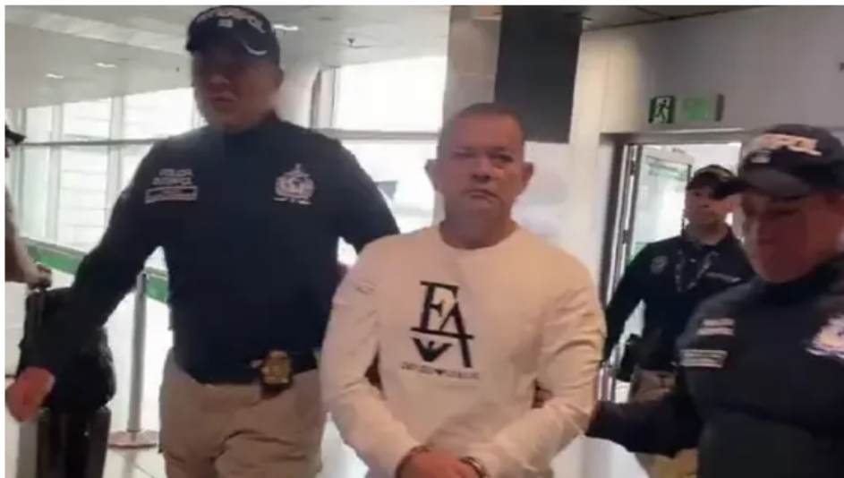
Extraditan desde Venezuela a alias 'ramoncito', exjefe paramilitar del Bloque Guaviare