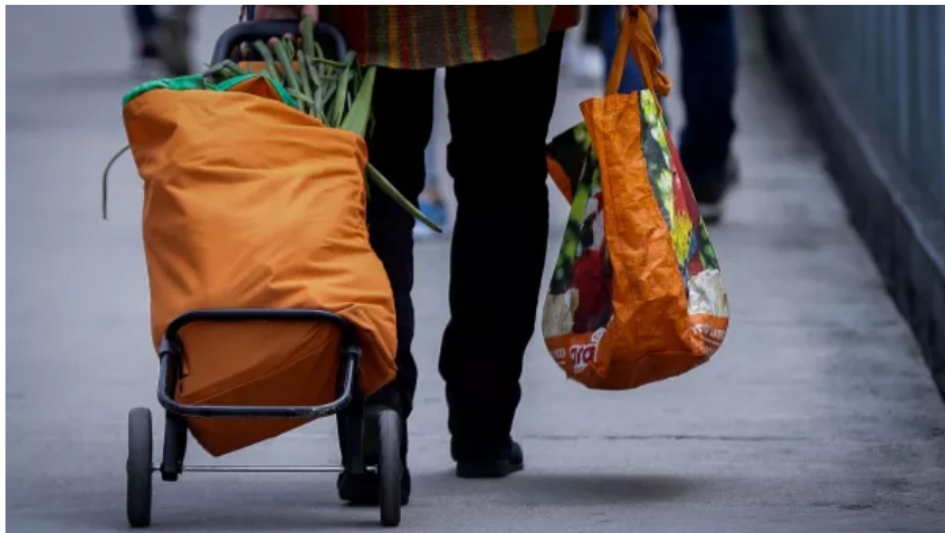
Inflación en Colombia sube a 5,56% en marzo de 2026