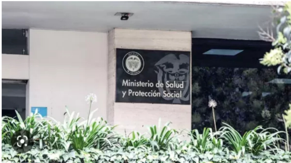
Convocan mesa técnica para revisar la UPC en medio de incidente de desacato