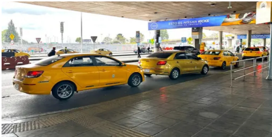
Levantan bloqueo de taxistas en El Dorado tras dos días de protestas: acuerdos frenan la crisis