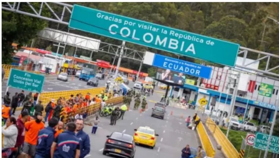
Ecuador endurece medidas: aranceles a productos colombianos al 100% desde mayo