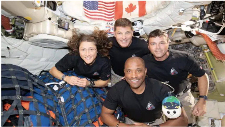
Artemis II: esta es la hora exacta del regreso a la Tierra de los astronautas