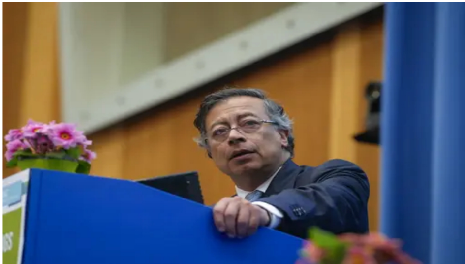
Petro califica de “monstruosidad” el aumento de aranceles de Ecuador