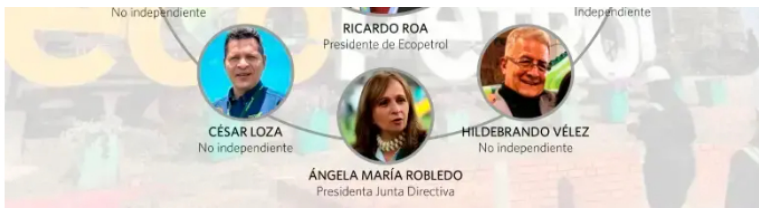
Junta de Ecopetrol

Asimismo, el informe desmitifica la versión oficial sobre el pago de la deuda del Fondo de Estabilización de Precios de los Combustibles (FEPC).