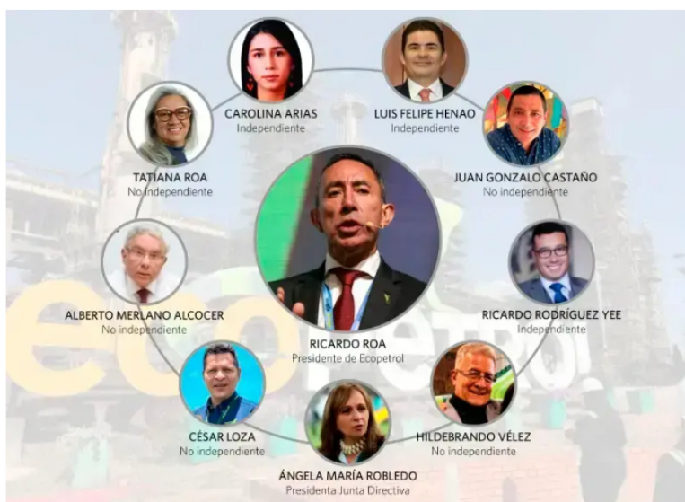
Junta directiva de Ecopetrol .

Hoy, la junta de Ecopetrol tiene cuatro miembros independientes y cinco no independientes, una composición que la propia S&P identifica como un obstáculo estructural para una mejora del rating . Que de cuatro condiciones explícitas de mejora, una sea la composición y renovación de la junta, dice mucho sobre dónde la calificadora cree que está el problema real.