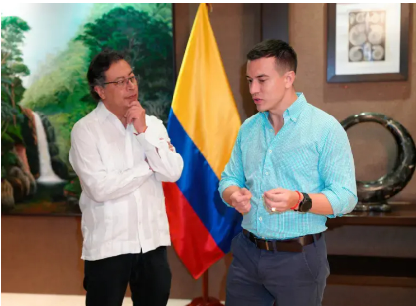
Ecuador eleva al 100% la tasa de seguridad a los productos importados desde Colombia.