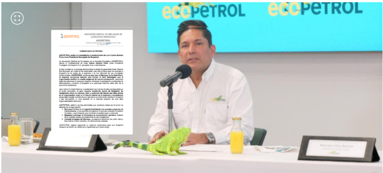
A través de un comunicado de prensa, la Asociación apoyó el nombramiento de Hurtado Parra.