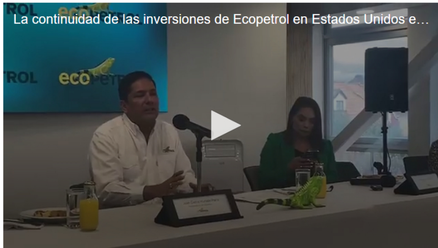
La administración resalta el control de indicadores clave y la optimización de gastos como parte de su estrategia para sostener el crecimiento, resguardando el equilibrio de las operaciones ante el entorno económico actual

El presidente interino de Ecopetrol, Juan Carlos Hurtado, anunció en Bogotá que la empresa analiza la posibilidad de aumentar su plan de inversión, impulsada por la reciente alza en los precios internacionales del petróleo derivada del conflicto en Medio Oriente.