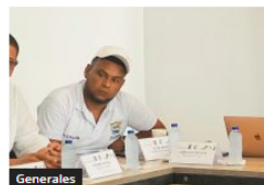
Generales Procuraduría suspendió a alcalde y funcionario de Altos del Rosario