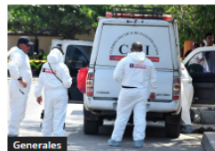
Generales Sincelejo, Sampués, Corozal y Tolú, municipios con más homicidios en Sucre