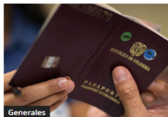
Generales Suspenden trámite de pasaportes en Sucre por fallas técnicas a nivel nacional