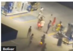
Bolívar Pese a incidentes que dejaron un muerto, alcalde Turbay ratifica a Cartagena como casa de Junior en Copa