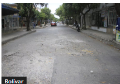
Bolívar Rehabilitarán más vías en la Localidad 2 de Cartagena