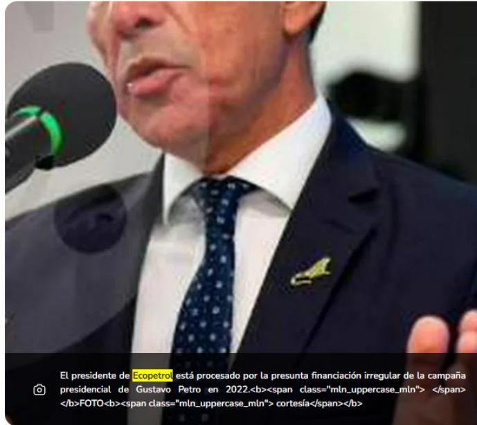
El presidente de Ecopetrol está procesado por la presunta financiación irregular de la campaña presidencial de Gustavo Petro en 2022.