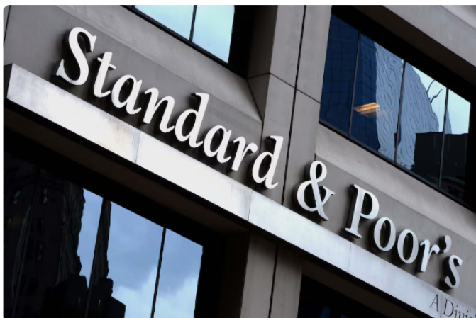
Standard & Poor's rebajó la calificación crediticia de Ecopetrol .

“La probabilidad de apoyo gubernamental oportuno y suficiente para Ecopetrol bajo estrés como muy alta, basada en la participación accionaria del gobierno del 88,49% y el papel crítico de Ecopetrol como el principal productor de petróleo y gas de Colombia”.