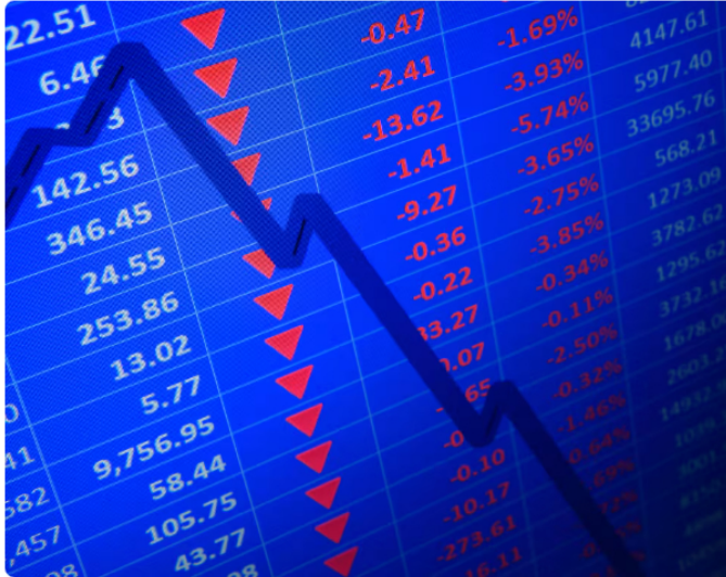
Este fue el cambio.

A esta situación se suma la política de dividendos, la cual presiona la sostenibilidad financiera, dado que la empresa ha distribuido entre 40% y 60% de sus utilidades, incluso pagando más dividendos que ganancias en 2024.