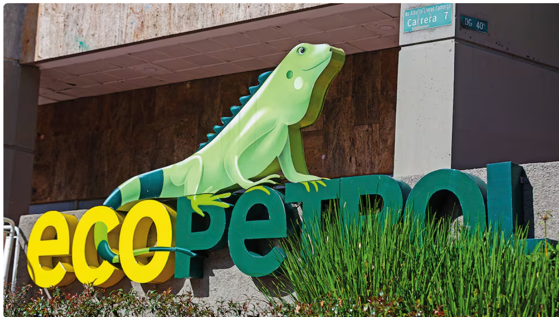
Ecopetrol recibió un nuevo golpe.

Hace algunas horas, la agencia estadounidense Standard & Poor's (S&P) decidió rebajar la calificación crediticia de la estatal petrolera Ecopetrol , luego de haber rebajado también la calificación crediticia de Colombia el pasado miércoles, hecho que desató una nueva polémica sobre el manejo de la economía por parte del Gobierno Petro y de los mensajes que se entregan a los mercados extranjeros.