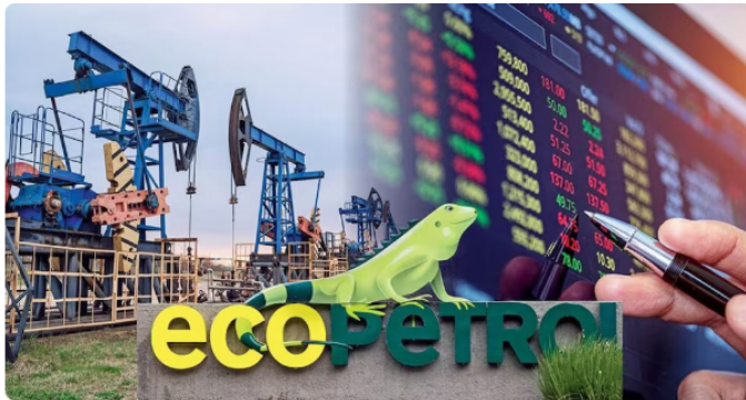
La petrolera es la empresa más importante del país.

La rebaja de la calificación de la empresa fue de BB a BB-, que fue la misma reducción que sufrió la calificación de Colombia y que dejó la posición soberana del país a niveles que no se veían desde 1993.