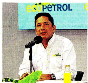
El presidente encargado de Ecopetrol, Juan C. Hurtado, en la rueda de prensa.

en la infraestructura de transporte, específicamente en los oleoductos y poliductos. Al respecto, el presidente (e) señaló que se están logrando "eficiencias importantes" para garantizar el suministro de carga a las refinerías y blindar la seguridad energética del país.