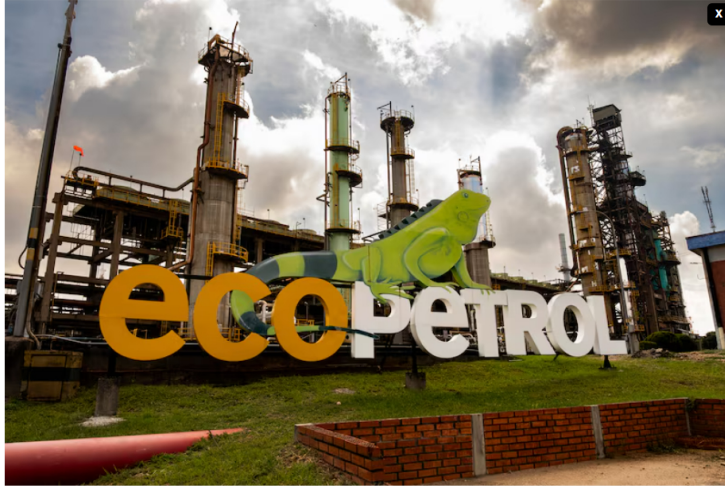
Ecopetrol se expone a volatilidad antes de la primera vuelta. ¿qué esperar de sus acciones? El miércoles S&P recortó la nota soberana de Colombia al considerar que el déficit fiscal sigue empeorando y que las mejoras que propone la administración de Gustavo Petro son insuficientes.

La política energética del Gobierno Petro ha sido uno de los puntos débiles de su administración. El mercado espera conocer su sucesor para tener idea de qué viene en materia de exploración petrolera en el país.