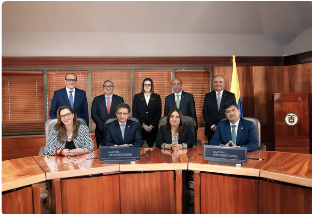
Sala Plena de la Corte Constitucional.

muestran como favorables a la población pueden intuir positivamente en la intención de voto de Cepeda —lídera todas las encuestas en primera y segunda vuelta—, como ocurrió con el aumento del salario mínimo en un 23 por ciento. ¿Y al revés? ¿También le pasarán factura a su campaña los múltiples choques institucionales protagonizados por Petro?