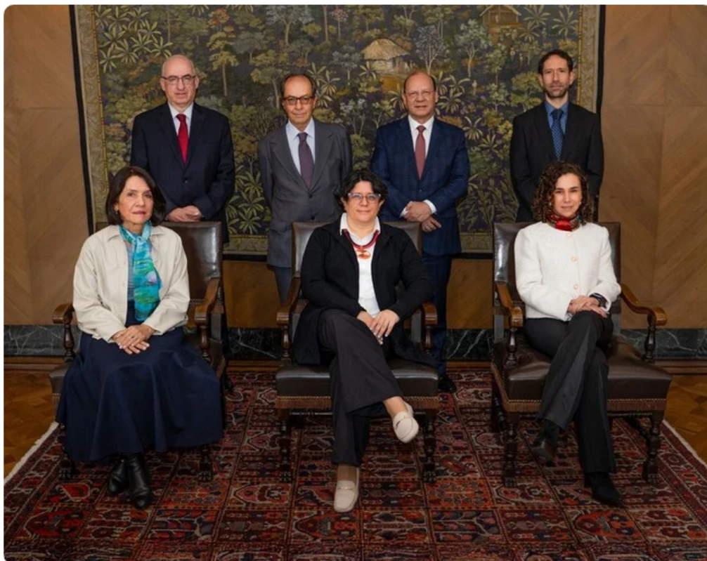
Tres de los miembros de la junta del Banco, junto al ministro, fueron designados por el presidente Petro.

¿En dónde está el secreto para este éxito? Algunos analistas consideran que este Gobierno ha logrado construir una conexión auténtica con amplios sectores de la sociedad tradicionalmente olvidados. Según esta lectura, existe una vocación genuina del mandatario por comprender las demandas sociales, lo que se traduce en réditos políticos.