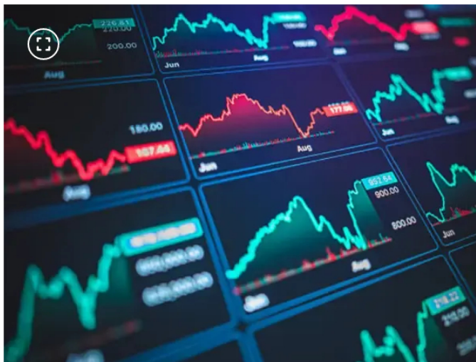
Pese a los retos, Ecopetrol sigue a flote gracias a los precios del petróleo.

El principal motor del mercado en marzo fue el desempeño de Ecopetrol , cuya acción subió cerca de 25% durante el mes, en línea con el repunte de los precios internacionales del petróleo. El informe señala que el crudo llegó a registrar aumentos de hasta 63%, lo que fortaleció las expectativas sobre los ingresos de la compañía y su impacto en el índice accionario.