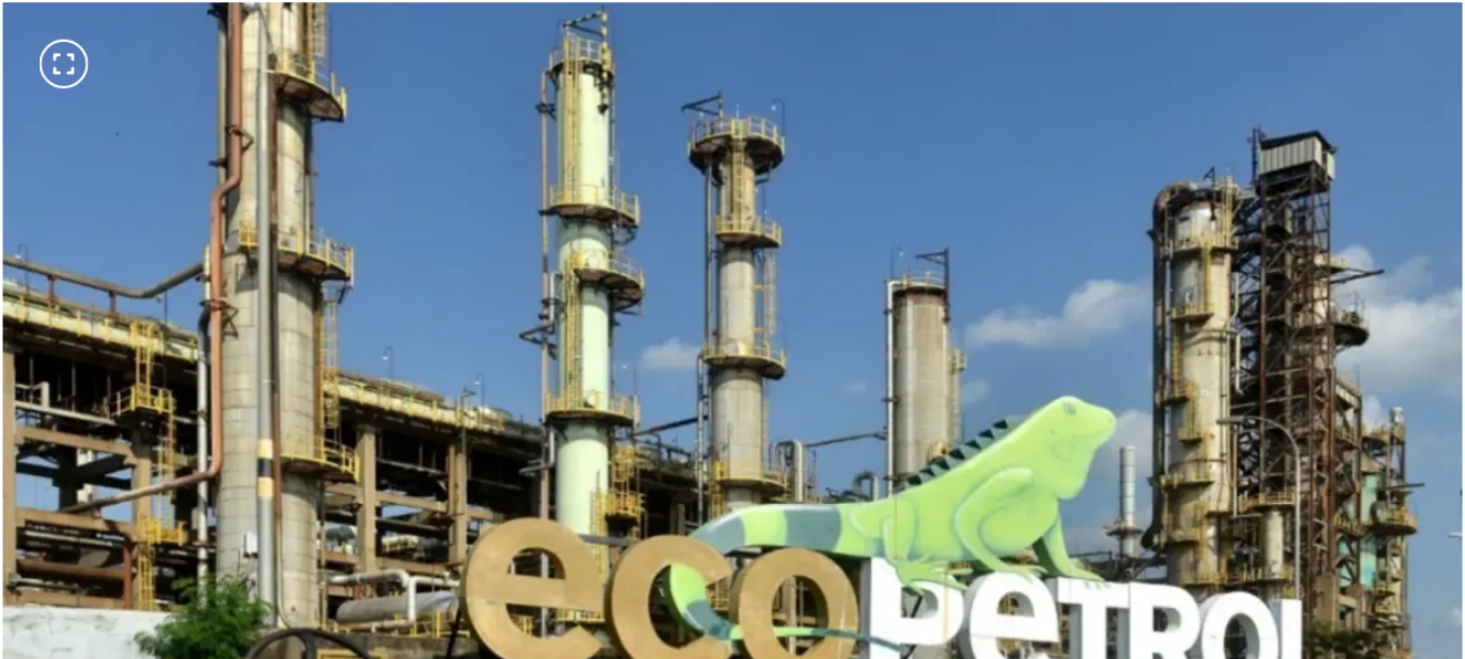
Pese a los retos, Ecopetrol sigue a flote gracias a los precios del petróleo.

El gobierno Petro tapa un hueco con otro: emitirá más deuda para pagar a Ecopetrol por FEPC