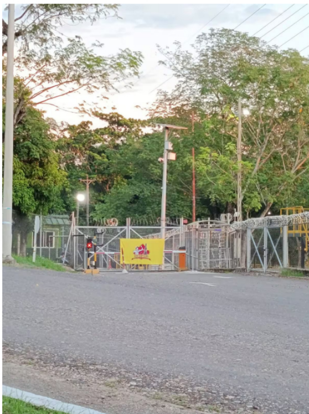
Durante 48 horas comunidades del corregimiento El Centro protestaron para exigir a Ecopetrol que mantenga la inversión en el campo petrolero La Cira Infantas.

Además del impacto laboral, las comunidades denuncian un rezago en la inversión social. Según Rodríguez, las condiciones en infraestructura del corregimiento en donde se ubica el Campo Petrolero siguen siendo deficientes. "No se ve inversión en vías, acueducto ni educación. Queremos que las autoridades lleguen y conozcan la realidad que estamos viviendo", agregó.