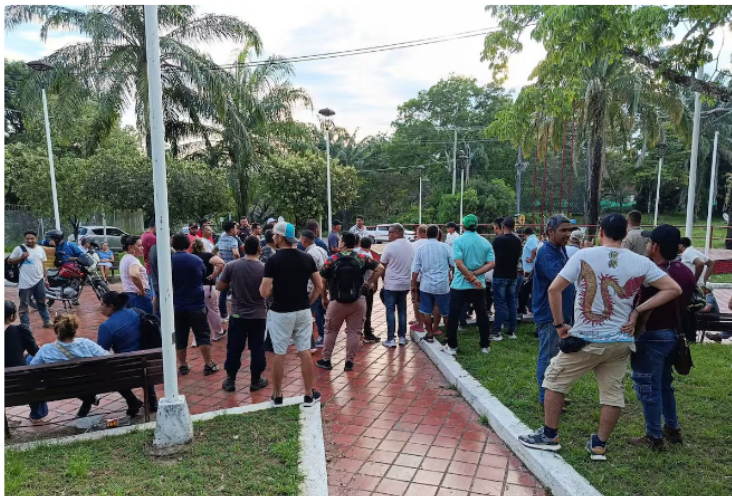
Durante 48 horas comunidades del corregimiento El Centro protestaron para exigir a Ecopetrol que mantenga la inversión en el campo petrolero La Cira Infantas.

Siga las noticias de Vanguardia en Google Discover