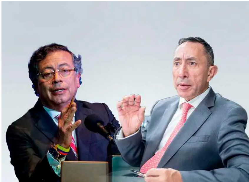
Petro aseguró que las críticas contra Roa responden a disputas por contratos en Ecopetrol.

El mandatario defendió la gestión del presidente de Ecopetrol y cuestionó a medios y autoridades, mientras evitó referirse a los problemas financieros y judiciales que rodean a la empresa.